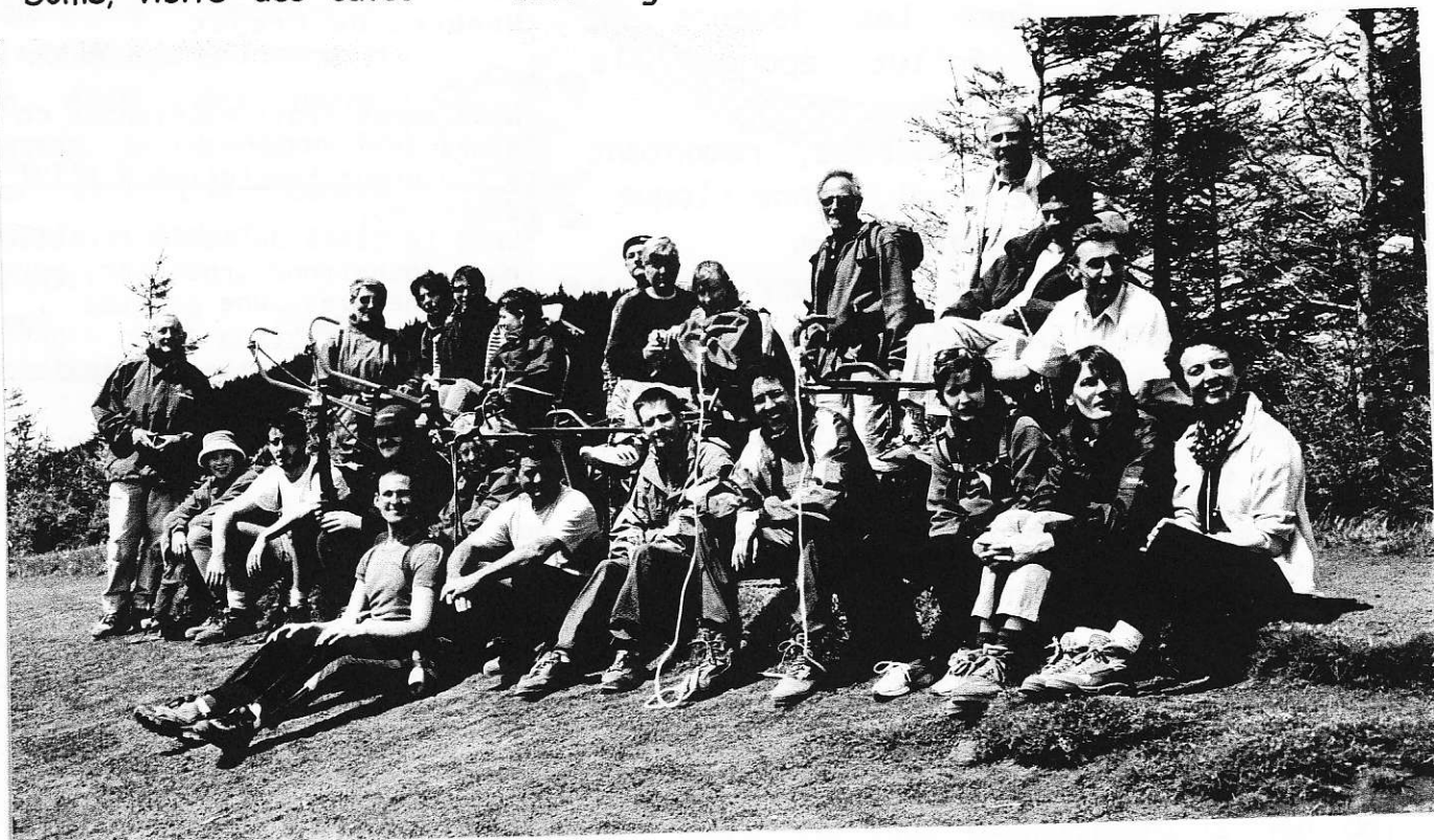
Le Groupe, lors du " grand " W.E. à Clermont - Pentecôte 2001