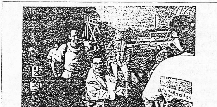
Le Cross des Marrons : le départ

(...) Donc en ce dimanche 22 octobre 95, rendez-vous nous a été donné à Gillonay, près de la côte St André pour la sortie du 23 ème Cross des Marrons. Comme chaque année, sans doute, une foule de marathoniens, près d'un demi-millier, équipés de short et de jogging se préparait à affronter, selon leur possibilité, le nombre de kilomètres auxquels ils étaient inscrits. En ce qui nous concerne, nous en joëlette, étions inscrits pour huit kilomètres six cents.